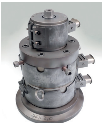
outillage sans isolation tool without insulation, before