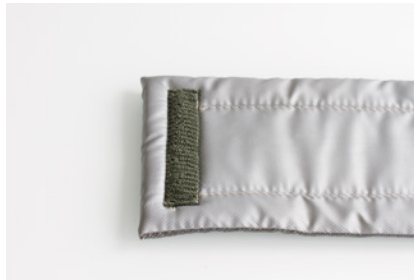
exemple 2 / exemple 2 fixation par velcro Velcro/fleece locking system