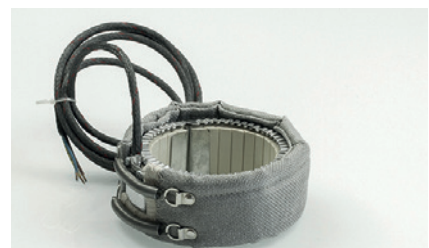
montage standard standard designs

susceptibles de modifications techniques