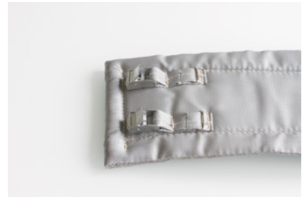
exemple 3 / exemple 3 serrage rapide fastener/belt locking system