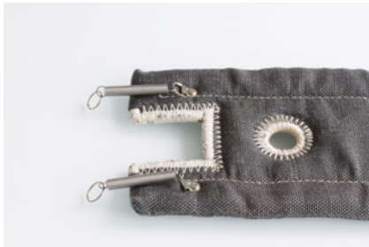
exemple 1 / exemple 1 serrage crochet avec ressort spring/ring locking system